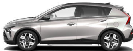
Elemental Brass Metallic Kontrastdach verfügbar