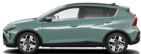
Mangrove Green Pearl Kontrastdach verfügbar