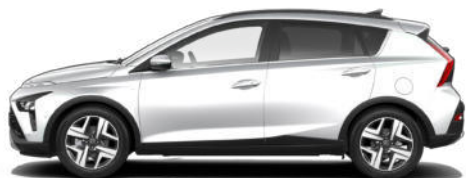
Sleek Silver Metallic