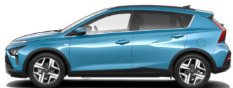
Aqua Turquoise Metallic