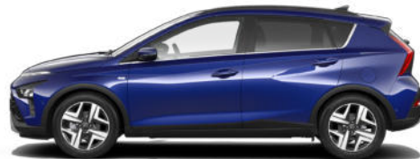
Intense Blue Pearl Kontrastdach verfügbar