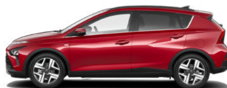
Dragon Red Pearl Kontrastdach verfügbar