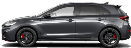
Dark Knight Gray Pearl