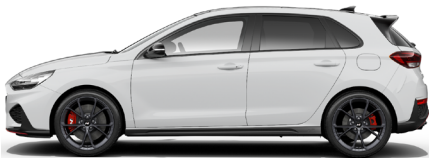
Serenity White Pearl