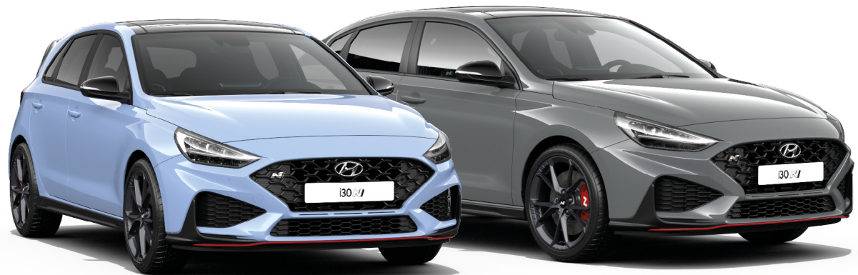
Preisliste Jänner 2023