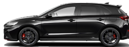
Phantom Black Pearl