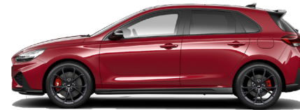
Sunset Red Pearl