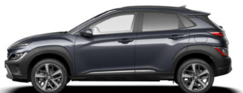
Ecotronic Gray Pearl Kontrastdach verfügbar