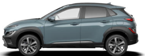
Jungle Green Pearl* Kontrastdach verfügbar