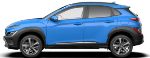
Surfy Blue Metallic* Kontrastdach verfügbar