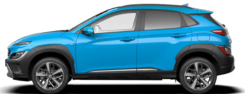
Dive Blue* Kontrastdach verfügbar