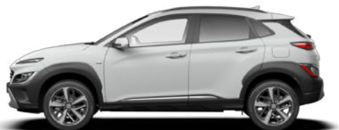
Atlas White Kontrastdach verfügbar