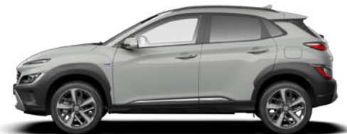
Cyber Gray Metallic Kontrastdach verfügbar