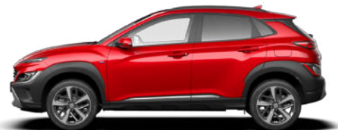
Ultimate Red Metallic Kontrastdach verfügbar