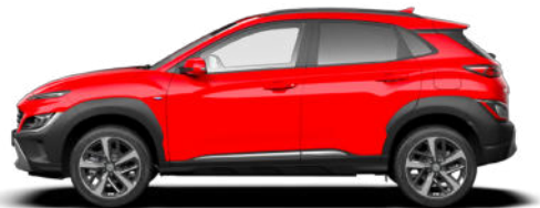
Ignite Red* Kontrastdach verfügbar