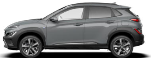
Galactic Gray Metallic Kontrastdach verfügbar